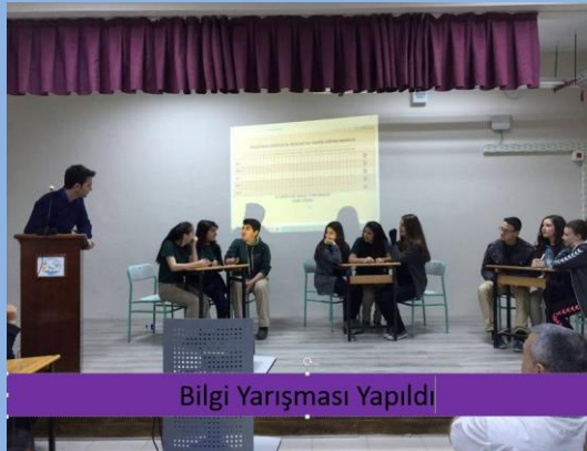
Bilgi Yarışması Yapıldı