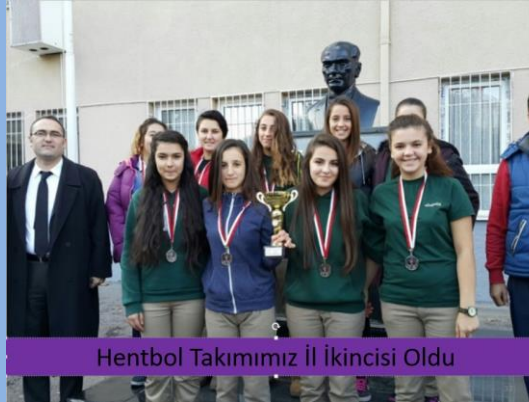
Hentbol Takımımız İl İkinçisi Oldu