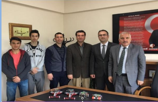
10.Uluslararası Robot Yarışmasına Hazırlık Yapıldı