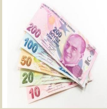
MALİ NİTELİKTEKİ OLAYLARINI